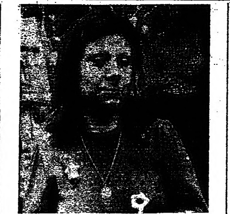
الإدعاء زنده سيمان صاحب سيارة المتوفى

تتعلق القضية المعلقة في جبل لبنان، التي تتولى التحقيق في جريمة قتل رئيس حراس بلدية الخضور المفقود، في قضية الهوية للصادرة في قضية مقتل رئيس حراس الحازمية، مع قضية مقتل رئيس حراس الحازمية.